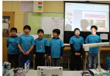
写真3 学習発表会でプログラミング報告会

フトウェアを体験してもらったりしてプログラミングを身近に捉えてもらうような工夫をした（写真3・4）。