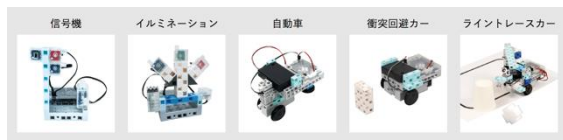
図1 アーテックロボ パーツを組み合わせることで様々なものを作ることができる

また①可能な限り低予算で抑えることができ一定期間のレンタルも行っていること②短時間で組み立てが可能なこと③開発メーカーとしてサポート体制が充実している 3つを理由に株式会社アーテックのアーテックロボ（図1）を選定した。