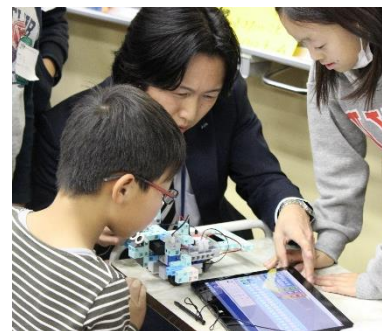
写真1 児童の疑問に応える教材開発担当者

まず、アーテックロボの教材に触れて間もない段階で設定した。児童はソフトウェアの使い方やロボットの部品の組み合わせ方など基本的な事項の理解が不十分な時期である。児童は各グループで理想とするロボットの製作に前向きに取り組んではいたが、自分たちの意図した通りにプログラムを組むことができないことに悩んでいた。グループであらかじめ整理しておいた疑問点について直接開発担当者から具体的に的確な助言をもらったことで、改善点に気づきプログラムの組み方を再検討することができた。さらに理想のロボットの動きになるように主体的に活動できるきっかけとなった。