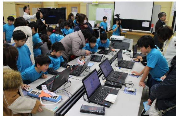
写真4 報告会にて保護者・地域との交流